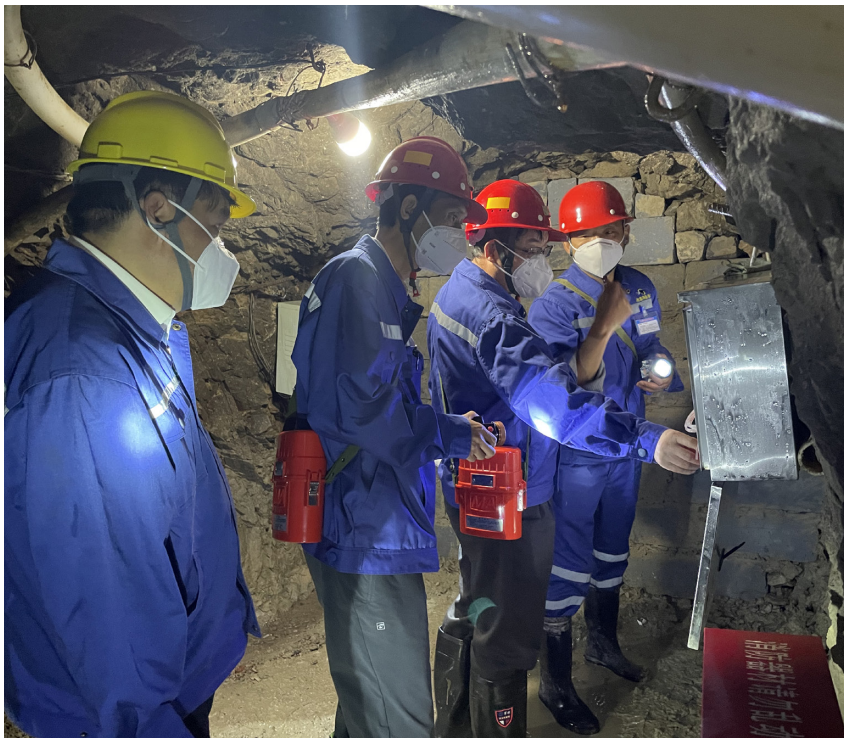
商洛市应急管理局检查地下矿山设备安全运营情况

同时，商洛市坚持安全生产任务清单化、管理精细化、责任链条化，积极履行全市安全生产综合监管和市安委办综合协调职能，健全完善安全生产联席会议