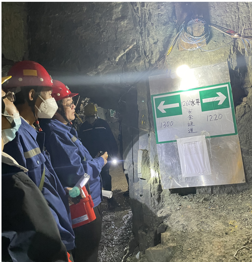
商洛市应急管理局检查地下矿山安全避险“六大系统”运行情况

极协调督促相关职能部门扎实开展自建房、城镇燃气、消防等重点行业领域安全生产专项整治，有效防范化解了一批重大风险，消除了一批安全隐患，遏制了生产安全事故。