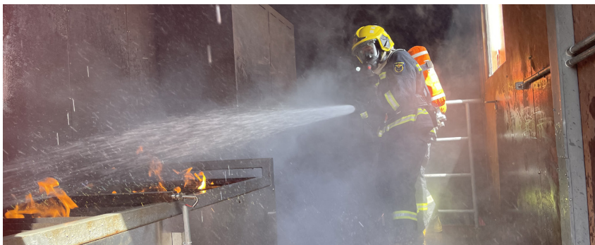
江永木参与灭火救援

1999年，为响应国家在各地成立特勤队伍的号召，支队决定在队伍里选拔一些能力强、能吃苦的特勤队员，成立一支能完成