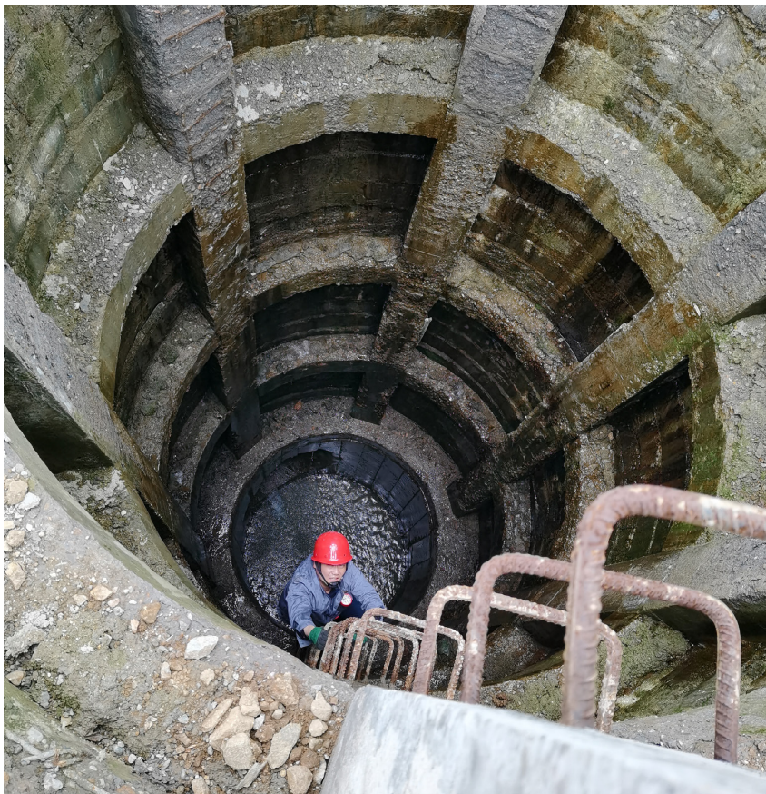
商洛市应急管理局检查尾矿库排水井安全情况

2022 年，为破解安全生产执法标准不高、力度不大及重复执法、多头执法的问题，该市创新推行了联县包片执法制度，建立“联县包片、分区检查、法制审核、扎口管理”的执法机制，把全市 7 县区、商洛高新区分为四个执法片区，由四个执法科室包片开展应急管理综合行政执法工作，分区分类提供针对性执法指导服务，