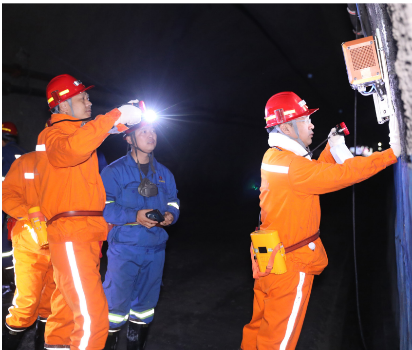
开展高瓦斯矿井预警系统专项督查现场

《规则》要求，监管监察部门对煤矿瓦斯超限作业、隐瞒下井人数、报警原因及处置措施填报弄虚作假等行为要依法从严从重查处；巡查发现煤矿企业存在人为破坏安全监控系统传感器、上传数据造假、关闭安全监控系统数据上传功能等行为，经核查