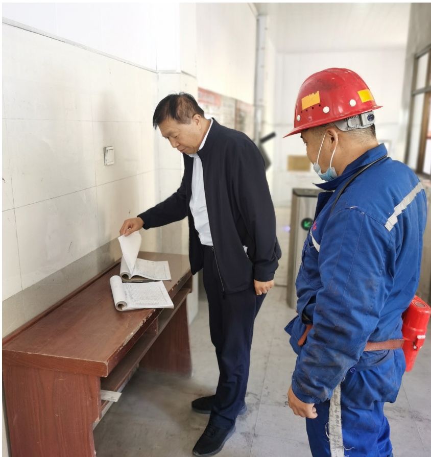
延安市应急管理局对陕西永明煤矿有限公司进行安全生产大检查

为筑牢安全防线，延安市进一步强化安全生产责任落实。压实领导包保责任，市县按照“党政同责、一岗双责、齐抓共管、失职追责”的要求，压紧压实属地安全责任和联系指导、包保煤矿安全责任，加强全面排查和动态巡查。压实安全监管责任，监管部门主要负责人亲自带队深入基层、靠前指挥，确保压力传导到一线、责任压实到一线、措施落实到一线，坚决杜绝走形式和“花式”检查。压实驻矿盯守责任，