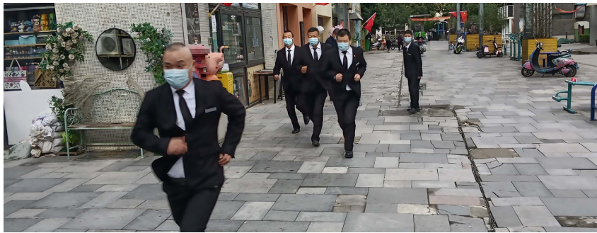
万达社区联合碧桂园开元国际物业开展消防应急演练

在指导社区创建减灾示范社区的过程中，新城区应急管理局指定专人负责，全程跟踪指导，对辖区内防灾减灾设施进行充分整合利用，帮助社区解决了许多难题。