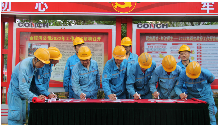
金陵河公司组织员工在安全生产月主题宣传横幅上签名

以铁的纪律、铁的心肠、铁的手段、铁的担当狠抓安全生产”“一个干部不重视安全就等于白干”……这是金陵河公司总经理、EHS管委会主任在各种会议上强调最多的内容。该公司以实干精神，硬核抓好安全生产工作，筑牢安全生产防线，全力以赴保障安全生产形势平稳向好。