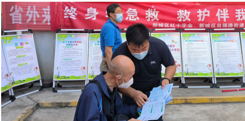
新城区应急管理局在社区开展防灾减灾应急救援知识与技能宣传培训活动

为提升社区综合减灾工作的制度化、规范化水平，新城区建立了灾害风险评估、应急演练、绩效考核、“一月一例会”、“一月一排查”等6项工作制度，制定了多