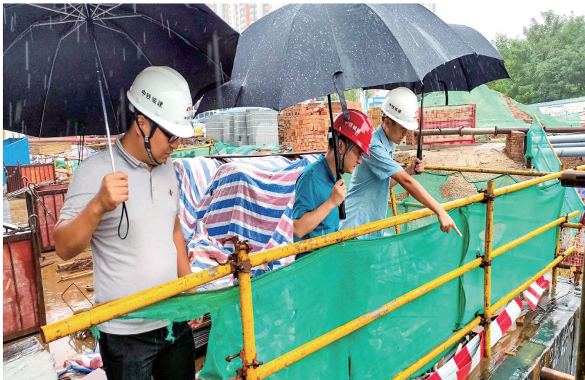
西安市有关部门工作人员对房屋建设项目开展汛前安全检查

西安市应急指挥中心先后接入了水务、城管、环保等部门预警监测系统，提升了全市防汛监测预警和指挥调度能力，实现重要情况全过程、全时段、全覆盖监测。同时，西安市畅通预警发布渠道，充分发挥网络平台、广播电视、手机短信