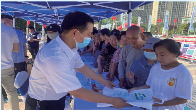
工作人员发放宣传资料

消防、工信等48家单位在渭南城区中心广场，开展渭南市暨临渭区“安全生产宣传咨询日”活动。一张张形式多样、内涵丰富的宣传资料、物品吸引了众多市民的关注、驻足。