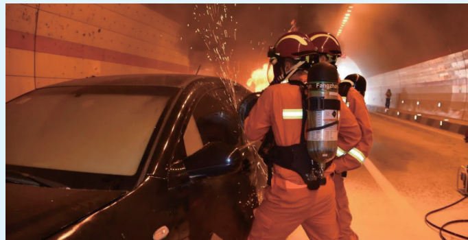
救援队员破拆车辆营救“被困”司机

消防救援支队派出8车45名消防救援人员，分成侦察救人组、灭火组、警戒组、供水组4个作战单元，协同交警、路政、医疗等小组，在现场指挥部的统一指挥下，顺利完成了侦察、救人、灭火、排烟、供水、警戒等演练环节，演练取得圆满成功。