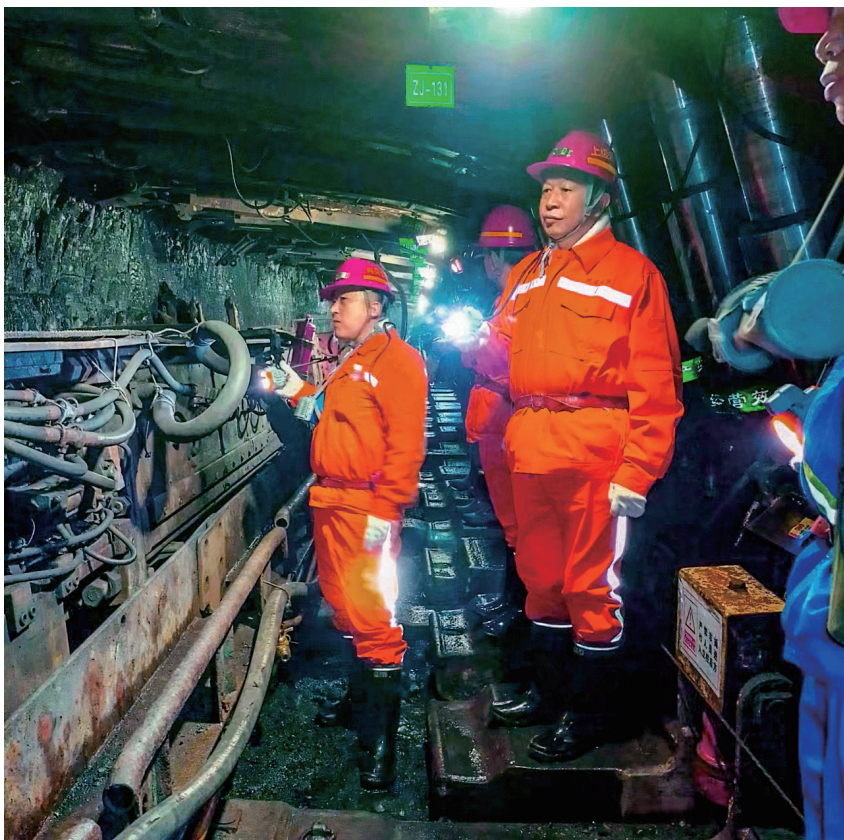
延安市应急管理局检查辖区煤矿井下安全生产工作

延安市把认真贯彻执行十五条措施作为推动工作、检验成效的根本标准，先后召开5次市委常委会、3次市政府常务会研究贯彻十五条措施的具体意见。为推动煤矿安全监管责任精准落实，该市政府办印发《关于市政府领导联系包保产煤县（市、区）和市级主体监管煤矿企业的通知》，明确了6名市政府领导（2名为市委常委）联系包保6个产煤县（市、区），市委常委、常务副市长刘晓军联系包保4处市级主体监管的煤矿企业，并细化了联系包保领导的职责任务，明确了由市应急管理局、市发改委、市自然资