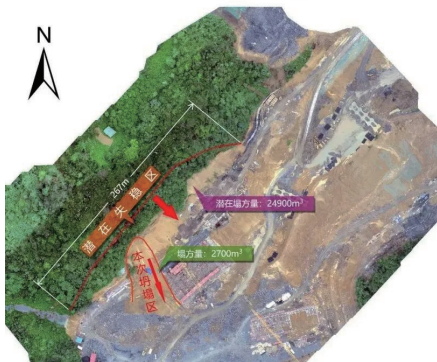
该工地边坡坍塌事故影像图

小结：施工单位管理不到位，导致防范工作功亏一篑。工人自身避险意识淡薄，也反过来说明施工单位没有培训到位，只注重出台一些“硬”措施，忽视了对工人思想的“软”教育，从而导致悲剧发生。