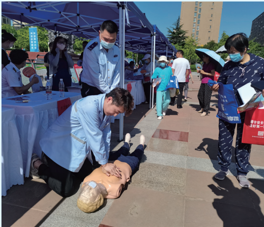
医务工作者开展心肺复苏急救教学

6月16日，宝鸡市安全生产咨询日活动在高新广场举行，来自宝鸡市安委会各成员单位、高新区安委会重点单位和全市重点企业和安全生产服务企业等70余家单位在现场开展安全生产宣传咨询活动，唱响人人“关心安全生产、参与安全发展”的主旋律。