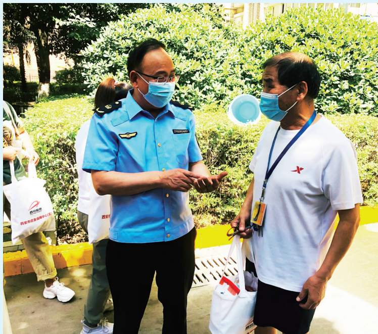
向群众讲解燃气使用安全知识

活动现场，该中心人员通过悬挂横幅、设立咨询台、发放宣传资料、有奖问答等形式，围绕“遵守安全生产法当好第一责任人”主题，向社区群众发放《安全生产法》《安全应急知识必备手册》宣传册、灭火器、防疫包、安全绳等宣传品，随后该中心党支部参观了社区