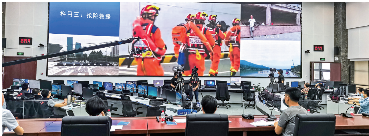
西安市防汛抗旱指挥部统一调度指挥防汛应急演练

把紧急避险、转移撤离人员作为首要任务和关键举措，最大限度减少人员伤亡和财产损失。