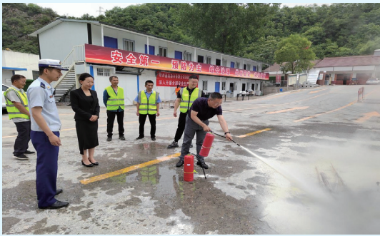
留坝县消防救援大队讲解防灭火器使用知识

在第 21 个全国安全生产月活动中，留坝县应急管理局持续推进安全生产知识宣传进企业、进农村、进社区、进学校、进家庭“五进”工作。6 月 9 日，留坝县应急管理局联合县消防救援大队，深入辖区陕西鑫鹏建材有限公司，指导企业开展了消防安全实战应急演练活动。在实战演练工作开始前，留坝县消防救援大队现场对消防救援服装的正确穿戴和消防灭火器材的如何使用等知识进行了现场