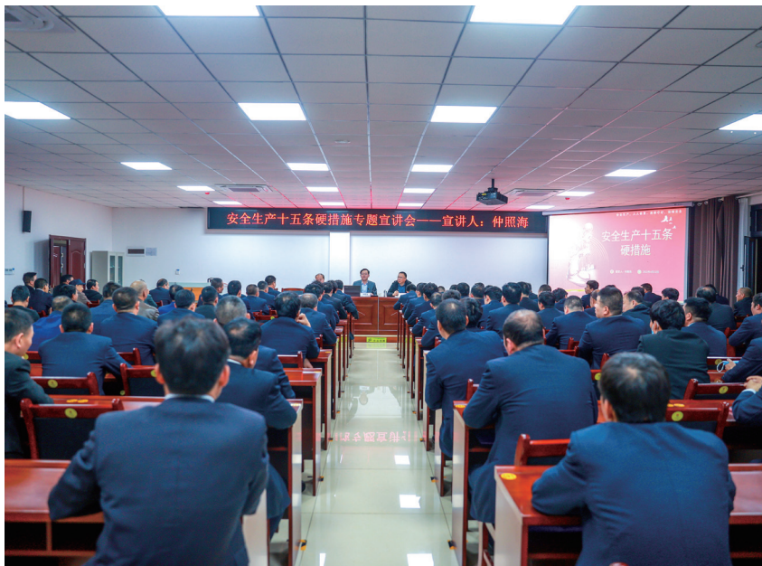
陕煤集团黄陵矿业公司双龙煤业举办贯彻十五条措施宣讲会

管控模式，建设了“AI+NOSA”智能风险管控系统，有效解决了人员“不安全行为”监管难的问题。