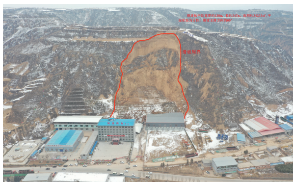
该村发生山体滑坡示意图

2022年2月9日9时许，岔沟村地质灾害巡查人员在山西树德农业科技股份有限公司西侧巡查时，发现附近山体有掉块及滑动迹象，巡查人员及时将隐患信息上报。当地政府第一时间组织该公司撤离临山车间内正在作业的50余名工人。11时50分左右，滑坡发生，推倒临山车间。由于预警及时、提前撤离，未造成人员伤亡。