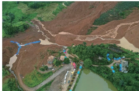
岔沟组山体滑坡示意图

2019年7月23日21时20分许，贵州省六盘水市水城县鸡场镇坪地村岔沟组发生一起特大山体滑坡灾害，43人死亡，9人失踪。