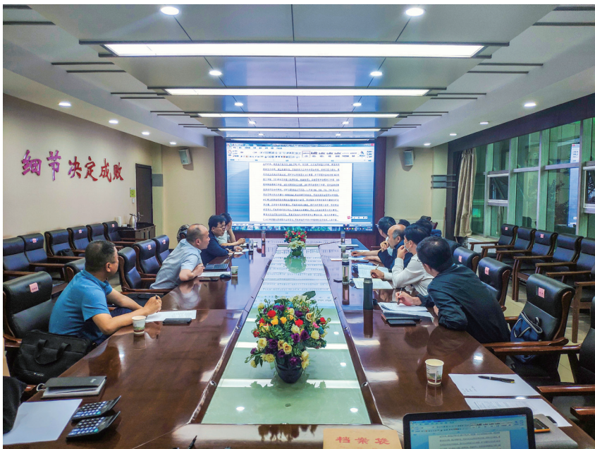
开展执法文书评判

此次执法技术比武由理论考核分和监察执法考核分组成，参赛队员理论考核平均分按30%计入总分，现场监察执法考核分按