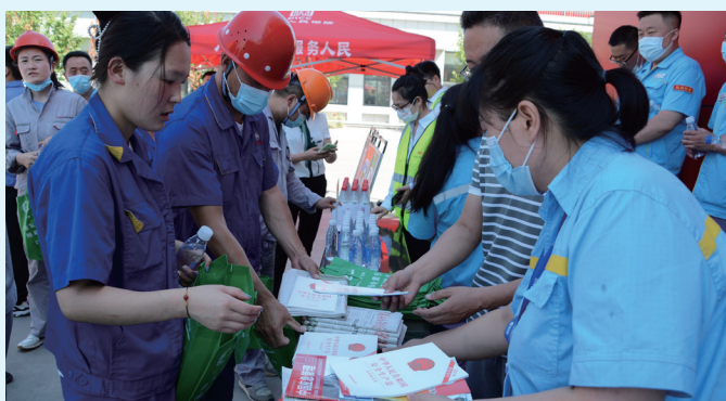
为各企业职工发放安全宣传资料

6月16日，铜川市安委办、市应急管理局联合中石油铜川销售分公司在新区崔仙加油站举办2022年安全生产月“安全宣传咨询日”活动。企业一线职工代表开展了安全宣誓，崔仙加油站介绍了站点安全管理情况，并向过往司机群众开展安全宣传咨询，发放安全宣传品和资料