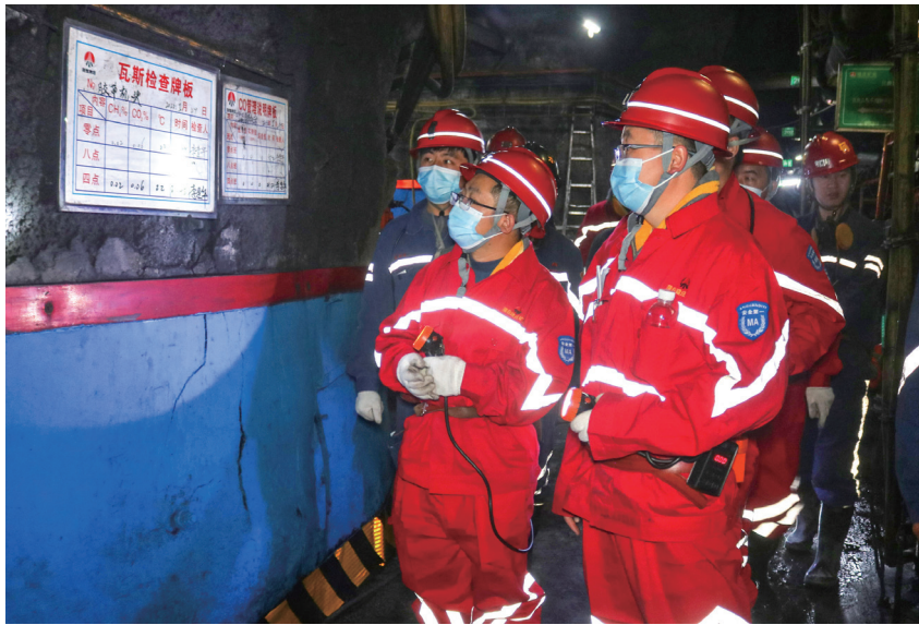
监察执法五处检查该矿井下瓦斯巡检记录