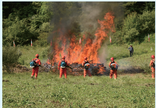
救援队员相互协作使用风力灭火机压制火势

演练以黎坪景区窝塘火情为背景，陕煤实业集团黎坪公司巡逻人员发现景区老黎坪窝塘山发生森林火情后立即向公司报告，黎坪公司立即启动森林防火应急预案，并由森林消防扑火队指挥员请示总指挥后，带领全体消防扑火队员紧急赶往火场，到达火灾现场后，在指挥员的统一指挥下，先后使用了 80 式火箭筒灭火炮弹、手持式灭火弹、风力灭火器、风力灭火机、智能消防机器人、高压接力水泵等工具开展扑火作业。消防扑火队员相互协作，密切配