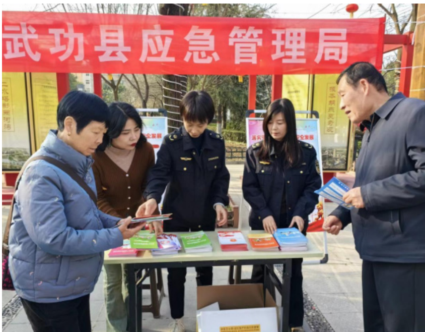
该局组织开展文明城市宣传活动

着力开展整顿治理。该局持续向市容“脏乱差”现象开刀，集中力量对屈家小区及沿街路面商铺等薄弱区域开展巡查，加大整治力度，确保道路、街巷、小区市容卫生整洁，巩固整治成果，确保全面达标。对路面铺装、路标路牌、消防设施、公益广告、公园绿地、停车位、墙面、盲道、垃圾桶等有污染、损坏、缺失的区域，持续做好整改工作，并通过“专项治理”活