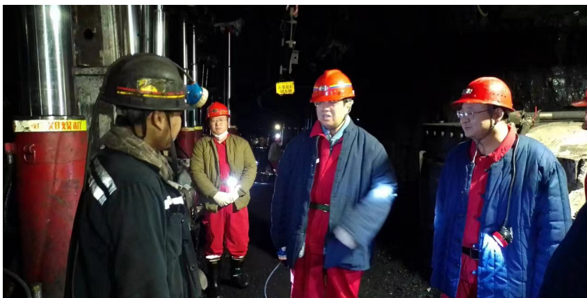
该县县委书记带队检查陕西金源招贤矿业有限公司

矿、道路交通、建筑施工、燃气、旅游、消防等重点领域，部署开展为期一个月的安全生产隐患排查大整治行动，常态化开展重大事故隐患排查整治。同时，还建立完善企业自查上报、部门执法检查、重大隐患排查治理工作机制。