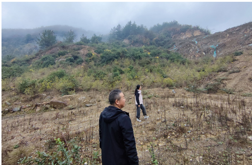
该局联合检查停产停建露天矿山开采边坡

佛坪县应急管理局在全县范围内深入开展打击停产停建矿山盗采专项检查行动，以铁腕手段守护县域矿山安全与资源保护红线，有效遏制非法盗采矿产资源行为，维护矿山安全生产秩序。