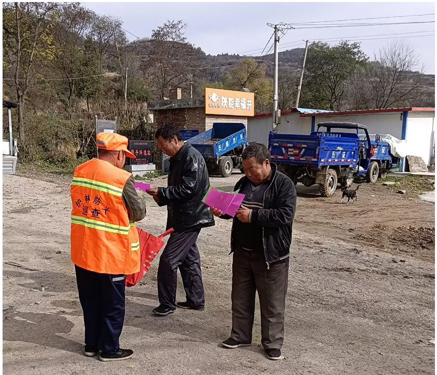
该县护林员向群众宣传森林防灭火知识

在防火期，该县严格执行 24 小时值班和领导带班制度，始终保持应急状态，随时能够应对突发情况。严格执行火情日报告和归口管理制度，对接收到的火情信息，经林业主管部门核查，确定是森林火灾的，在第一时间反