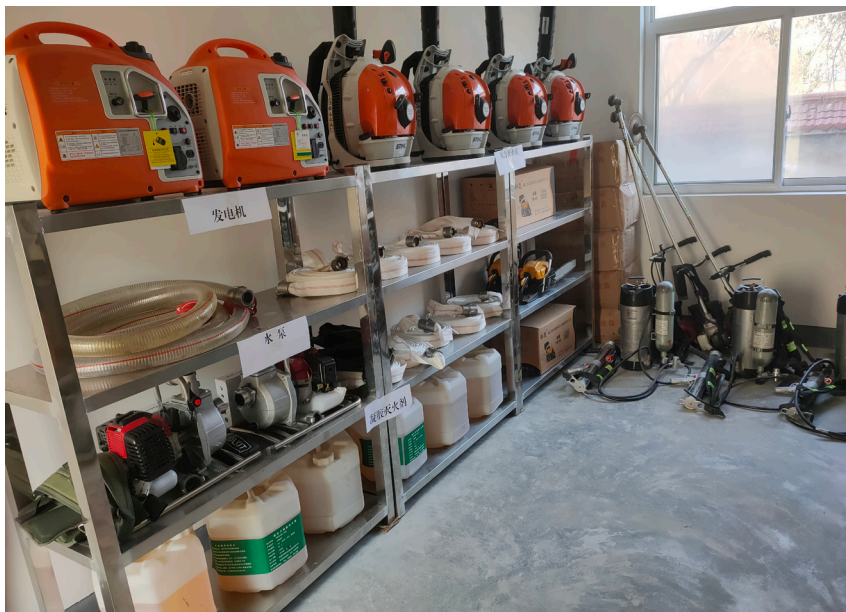
该县森防办及时补充各类防火物资

“一场火灾，会给森林带来哪些危害？引发森林火灾的因素有哪些？如何进行科学有效的预防？”2024年11月28日，在麟游县文化广场开展的“消防宣传月”活动现场，志愿者们结合森林防灭火工作向群众发放宣传材料，宣讲森林防灭火知识，详细讲解进入林区的注意事项和发生火灾时的应急措施。现场群众与工作人员热情互动，交流咨询。