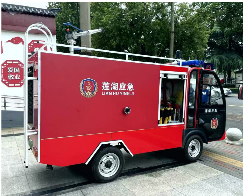
该区为街道配备城市综合应急救援车辆

道配备集指挥、监控、救援于一体的城市应急综合救援车辆，除用于日常开展巡查、宣传外，在急时助力灾害事故指挥救援，并与社区紧急救援站优势互补，有效构建集物资储备、安全巡查、教育培训、应急救援于一体的工作网络。