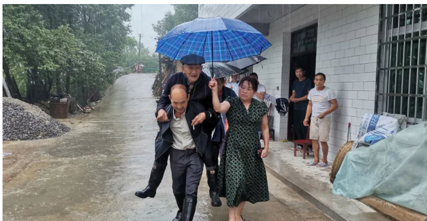
该市宁强县汉源街道撤离涉险群众

该市预计投入 7 千余万元，对正在推进建设的城市综合运行管理服务平台和已建成的“雪亮工程”、智慧消防、地质灾害一张图等信息化平台进行硬融合，新建风险预警联动处置、风险分析模型及算法等九大系统，构建全域覆盖的城市安全风险感知体系和“事前预警、事中可控、事