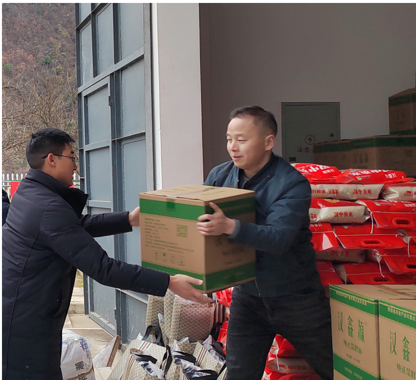
该局发放冬春救助物资

该局接入了“气象多普勒雷达系统”并安装了地震发布终端；在全县安装了 55 个森林防火语音提示器，实时监测地震、森林火灾等灾害。