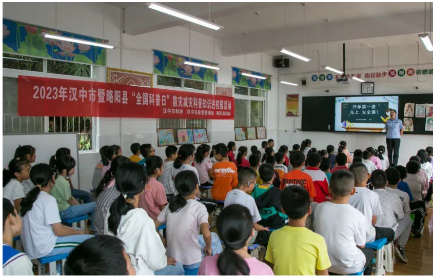
该市应急管理局赴略阳县开展校园安全教育

该市编制应急抢险救援完整流程和应急指挥模板方案，建立矿山、危化品、森防、洪涝灾害等20个方面四级应急响应菜单管理流程图，组建市县应急救援队伍136支4842人（其中市级专业队伍21支961人），镇村级防汛抢险和巡堤查险队伍2265支5.99万人，开展“砺兵-2023”汉中市森林火灾等演练，应急救援处置能力持续提升。按期推进消防救援支队“六合一”项目、勉县二站、留坝江口小型站等项目，新配备各类消防车16辆、新增器材装备7886件套，同比分别增加78%和12%，力量布局不断优化，灭火救援能力进一步提升。